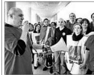
Kreative Mittagspause: Warnstreik in der MHH-Ladepassage. Steier

eigenen Tarifvertrag. Im Zuge der landesweiten Warnstreiks waren in Hannover gestern auch die Diakonischen Dienste betroffen. Die Mitarbeitervertretung organisierte Aktionen vor Anstalt und Henriettenstift, zu denen etwa 120 Mitarbeiter gekommen waren.